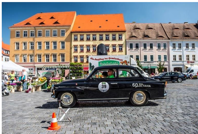
In der Wertungsprüfung, Fahrer versucht die Lichtschranke zu treffen, Beifahrer zählt

Am Freitag war unsere Startzeit 8:22 vor dem Internationalen Congress Center in Dresden direkt an der Elbe. Die erste Wertungsprüfung des Tages fand wieder in der Flutrinne statt, diesmal 50m in 13 Sekunden rückwärts.