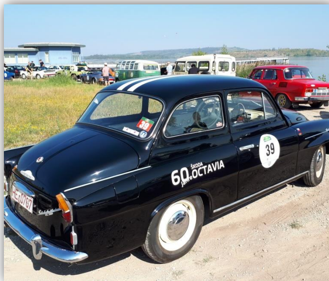
Zeitkontrolle am Geiseltalsee

Über die Marina in Braunsbedra mit einer Zeitkontrolle am Geiseltalsee ging es dann weiter zur Mittagspause bei Rotkäppchen in Freyburg. Wer immer noch nicht weiß, wo die blühenden Landschaften der neuen Bundesländer liegen, dem empfehle ich den letzten Teil unserer Route: Zwenkau und Störmthaler See. Früher am Tagebaurand, heute Badestrand.