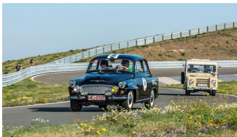
Wertungsprüfung auf dem Porsche Testgelände

Am Samstag der Start wieder im Porsche Werk. Hier gibt es genug Platz für die Wertungsprüfungen, und dieser Platz wurde vom Veranstalter auch genutzt. Gleich drei Wertungsprüfungen zu Beginn des Tages. Porsche besitzt auf dem Gelände eine eigene Prüfstrecke. Hier sind Teile der berühmtesten Rennstrecken Europas nachgebildet, erst kürzlich ist eine Kurve eingebaut worden, die dem Karussell des Nürburgringes entspricht. Hier auch der Höhepunkt des Tages und die schwierigste Wertungsprüfung. Drei Runden mussten gedreht werden. In einer Referenzrunde musste man sich selbst eine Zeit vorlegen. In zwei folgenden Runden sollte dann die vorgelegte Zeit möglichst genau wieder getroffen werden. Sehr anspruchsvoll, auch die zwei Minuten Vorgabezeit erforderten ein hohes Tempo und danach hatten nicht nur wir das Problem, dass wir die Ausfahrt nicht auf Antrieb fanden. Also versehentlich noch eine Runde. Es entstand insgesamt relatives Durcheinander, das auch der Veranstalter bei der Auswertung nicht aufdröseln konnte und so blieb nichts anderes übrig, als diese eigentlich hochinteressante Wertungsprüfung zu neutralisieren.