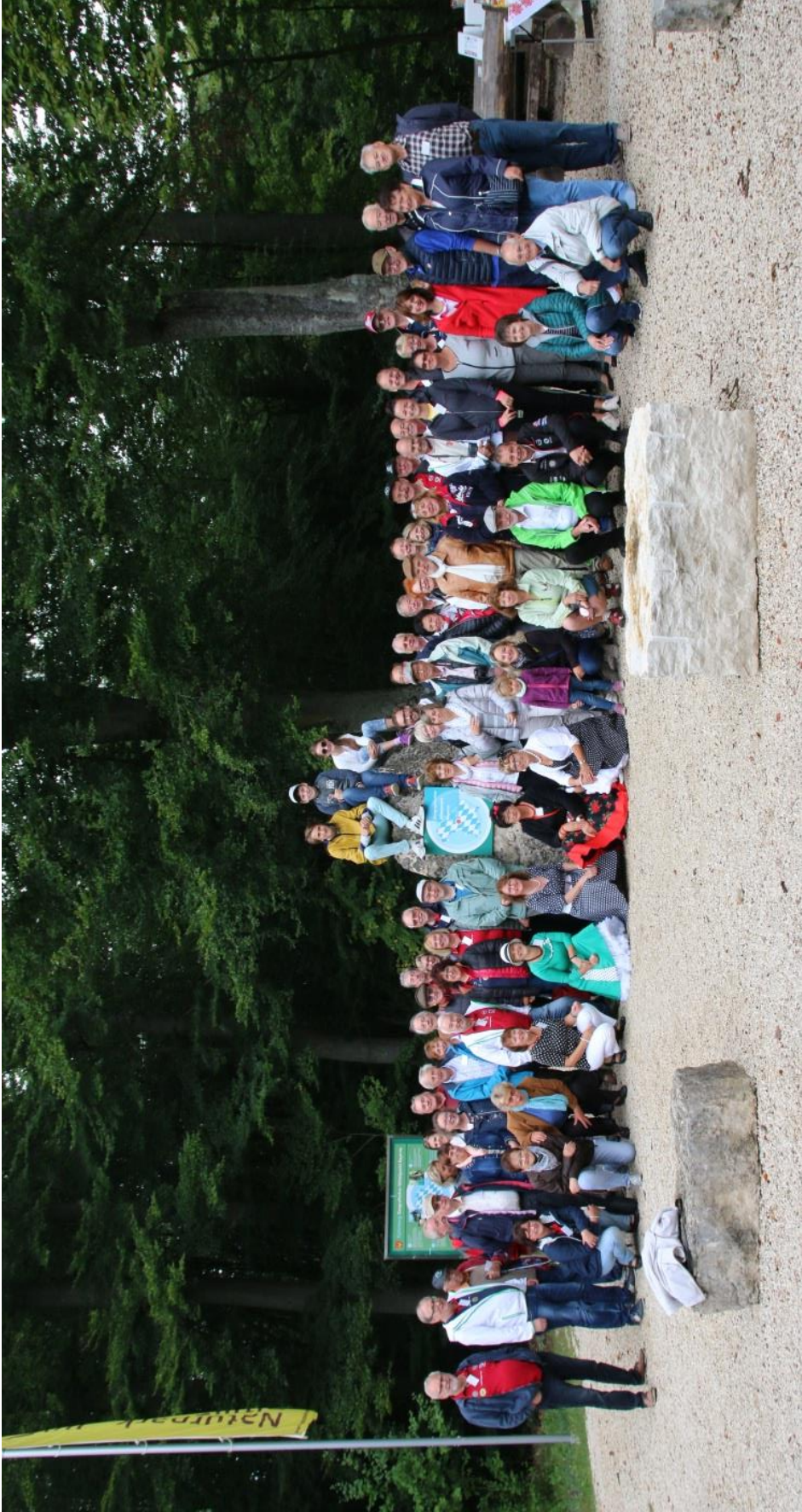
Herbsttreffen 2019 am geografischen Mittelpunkt Bayerns