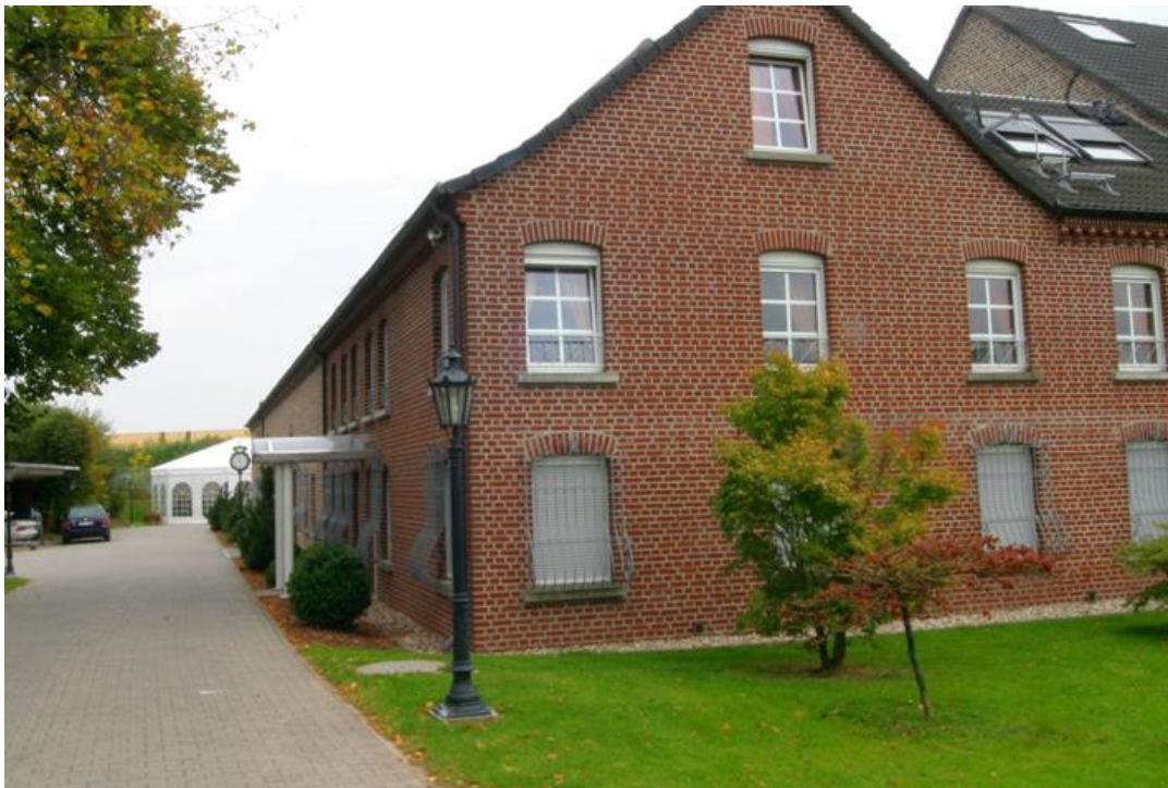
Foto zum Landhaotel Classhoff in Willich Im Neubuschweg 2

Seine Entstehung verdankt Brüggen seiner geografischen Lage. An der einzigen passierbaren Furt über die Schwalm gelegen, bildete sich an der Kreuzung zweier Handelswege zwischen Rhein und Maas eine erste Siedlung (erstmalig 897 urkundlich erwähnt). Vom heiligen Abend des Jahres 1289 datiert die erste urkundliche Erwähnung der Burg Brüggen und ihrer Mühle. Gegründet ist die Burg inmitten der sumpfigen Schwalmaue auf einer 16 m mächtigen Kiesinsel, die ihrerseits auf dem Moor schwimmt. Mitte des 14. Jahrhunderts baute in die damals nur vierstöckige Burg zu einer Festung mit vier runden, gleich großen Türmen aus, einem breiten Wassergraben und stockte die Gebäude zwischen den Türmen dann im 17. Jahrhundert auf heutige Höhe auf. Die Geschichte sieht man der Stadt heute noch an.