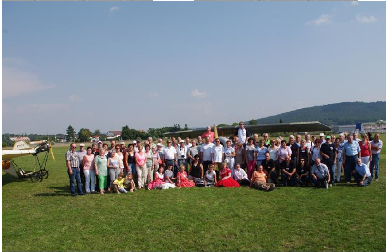
Gruppenbild der Škoda Oldtimer IG Teilnehmer auf dem Flugplatz in Mlada Boleslav mit historischen Flugzeugen

Diese Seiten stellen einen Auszug aus dem Kurier Nr. 3 / 2014 dar