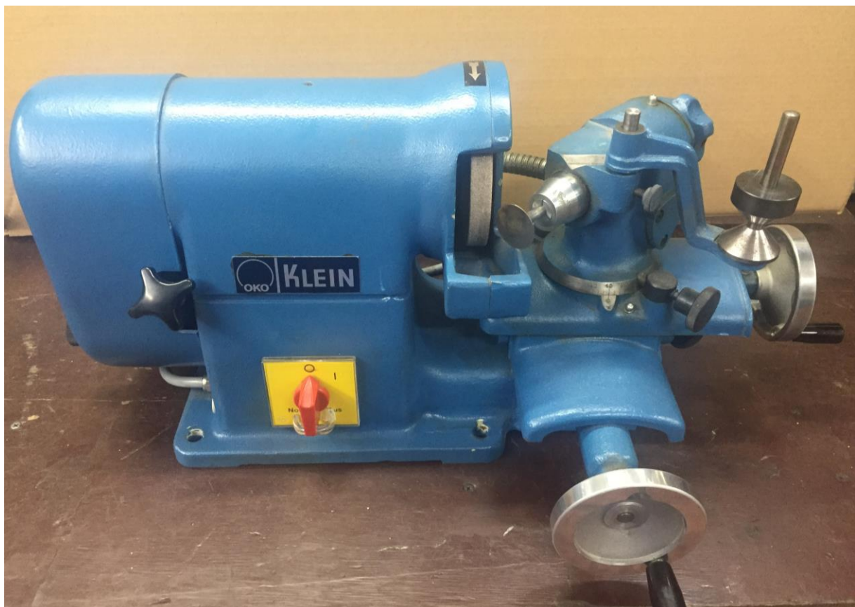
zeigt die Ventilschleifvorrichtung der Firma OKO Klein