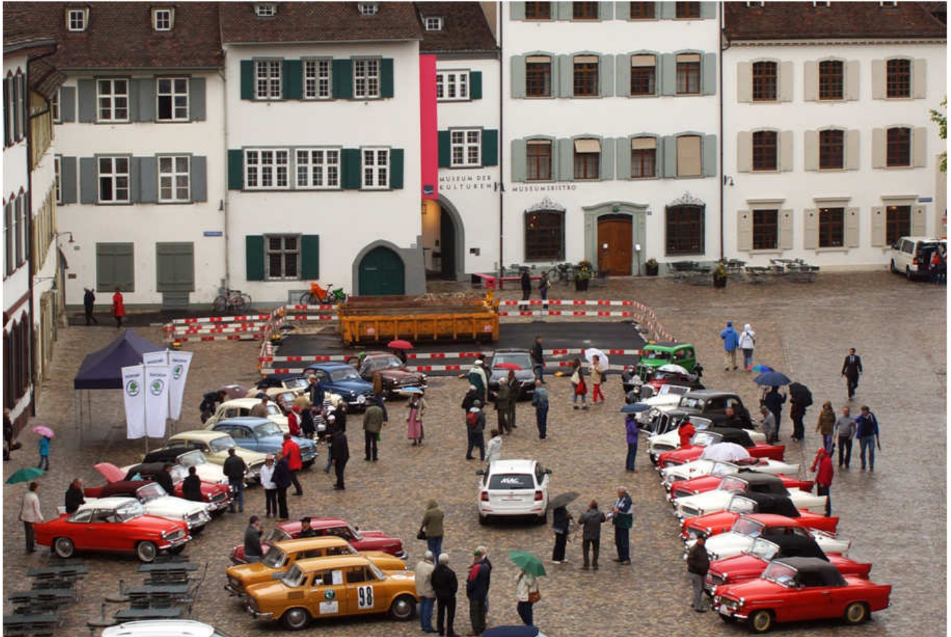
27 Škoda Oldtimer auf dem Münsterplatz in Basel beim Frühjahrstreffen im Dreiländereck Schweiz-Frankreich-Deutschland vom 08. Mai bis 12 Mai 2013