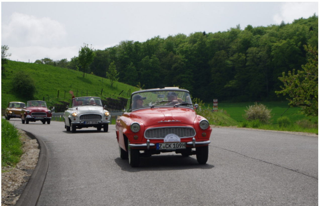
Škoda Oldtimer bei der Fahrt durch das Baseler Land