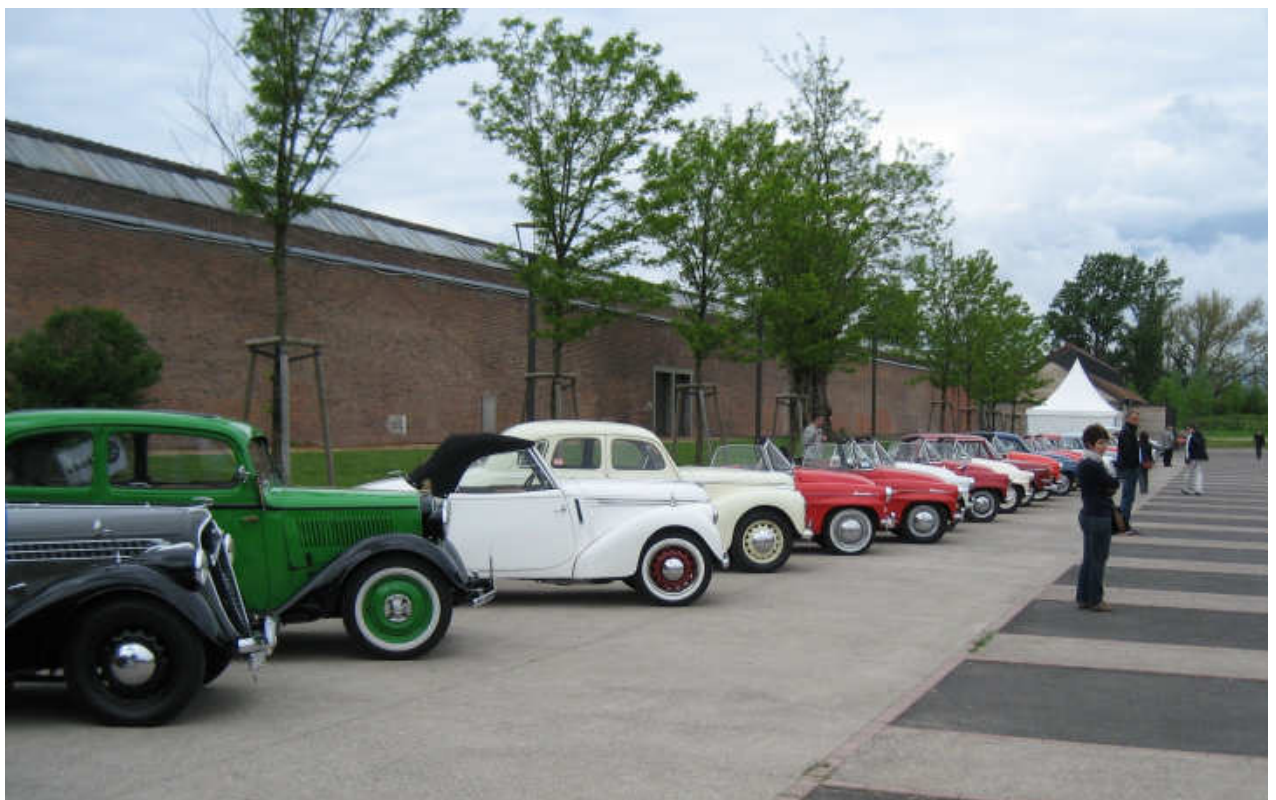
die Škoda Oldtimer konnten im Museum an dem Motodrom geparkt werden