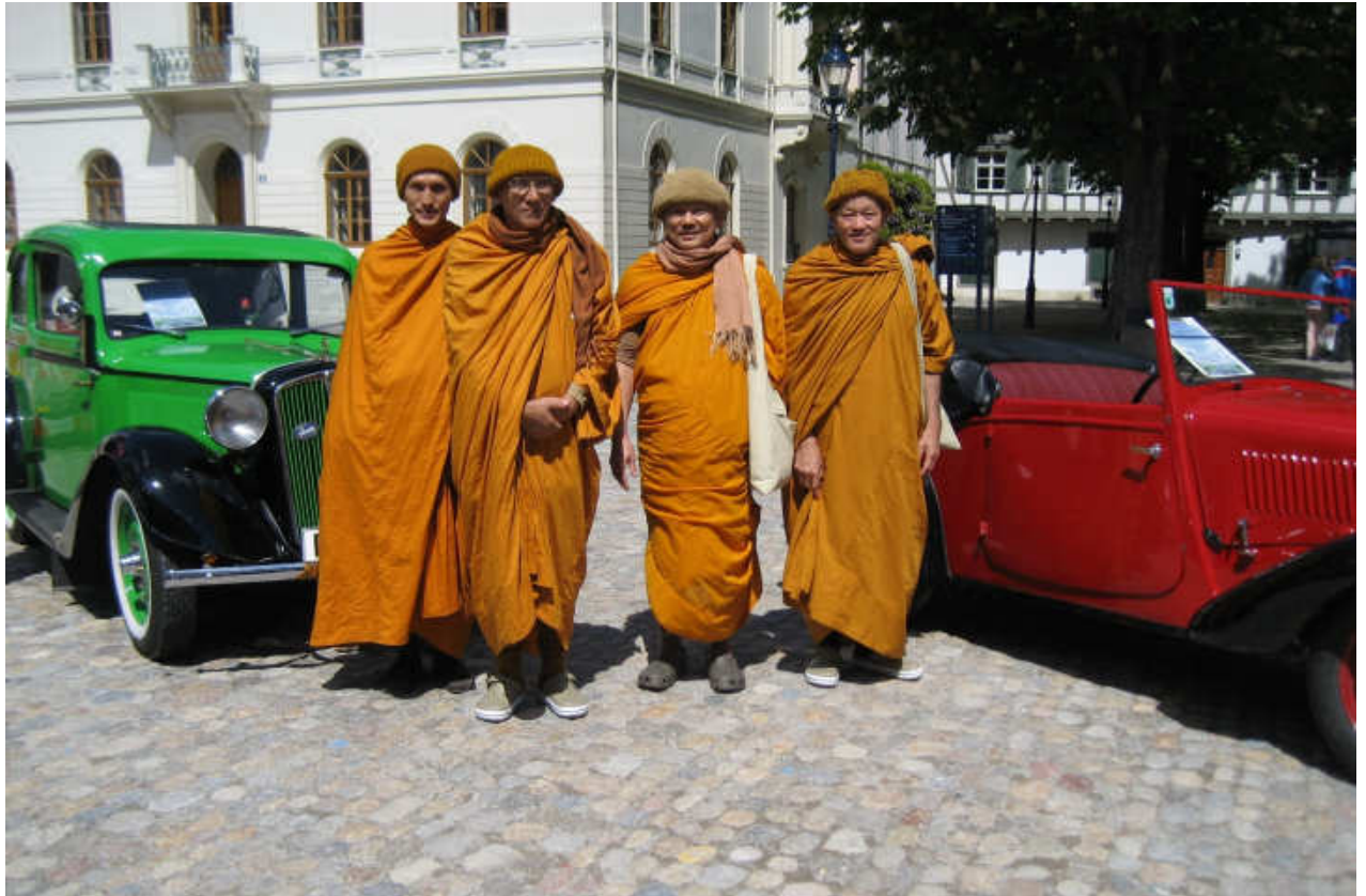
auch Tibetische Mönche hatten großes Interesse an unseren Škoda Oldtimern