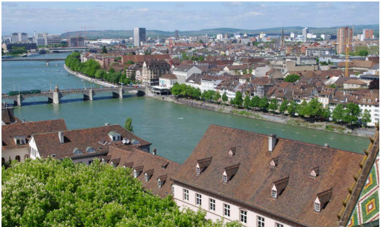
Ralf bestieg den Turm des Baseler Münsters und hatte von oben einen herrlichen Blick über Basel