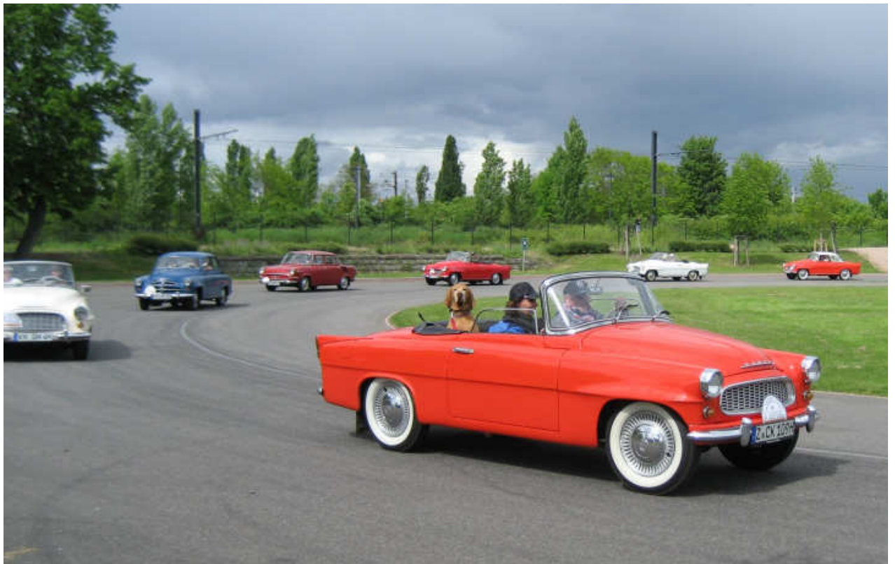
Zum Abschluss des Museumsbesuchs stand uns das Museums eigene Motodrom für einige Runden mit den Škoda Oldtimern zur Verfügung