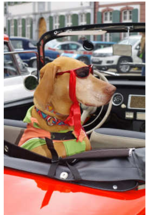
Sein Outfit wird immer eleganter wir