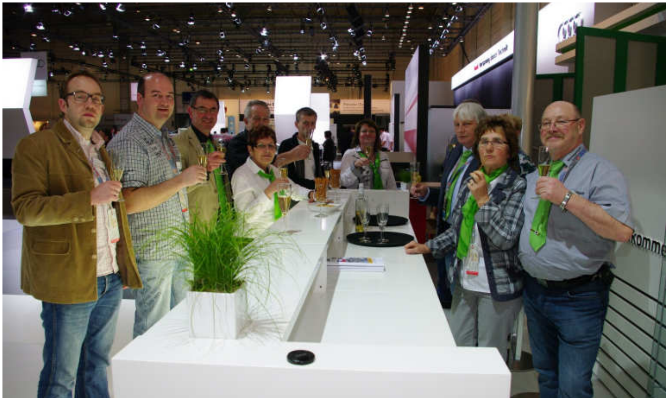
Mitglieder der Škoda Oldtimer IG auf dem Messestand der Techno Classic in Essen