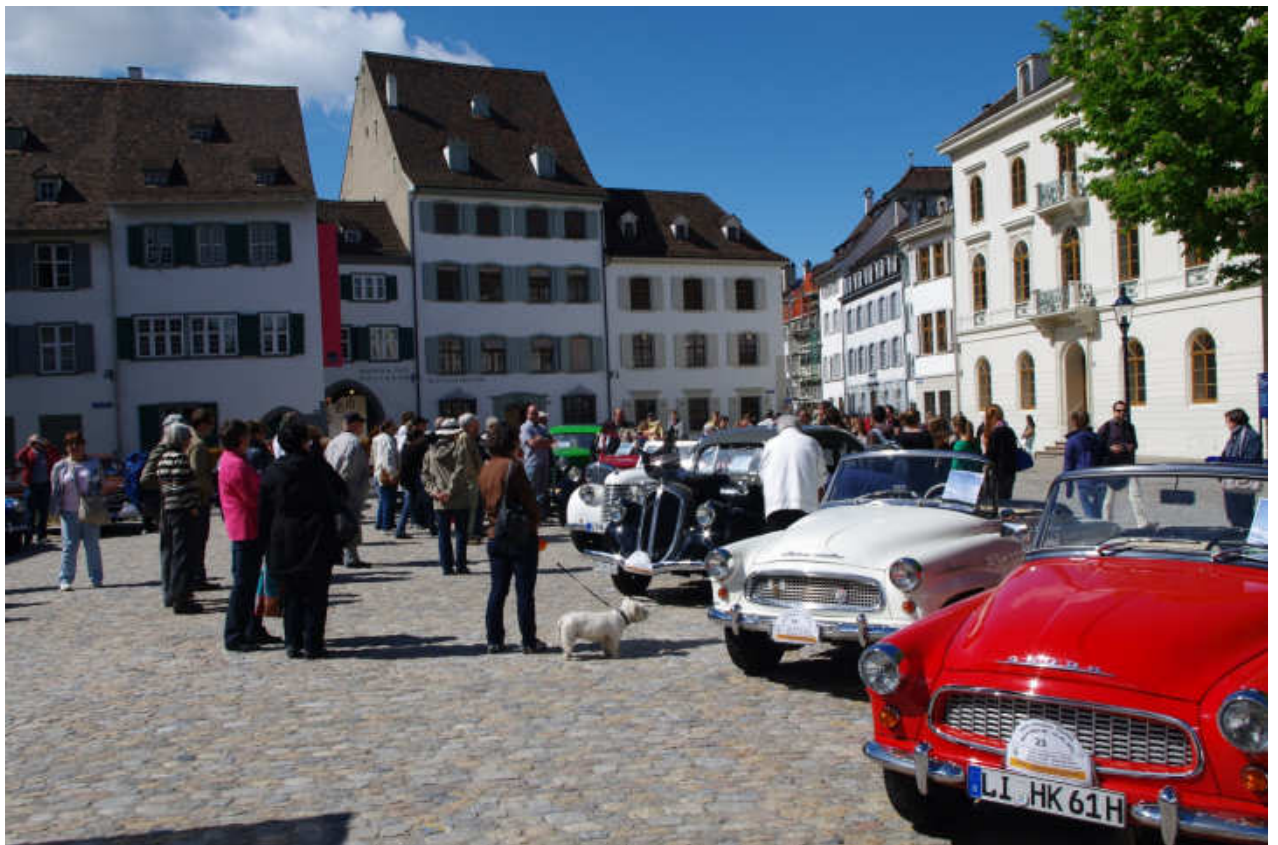
auf dem Münsterplatz waren unsere Skoda Oldtimer ständig von Besuchern umgeben