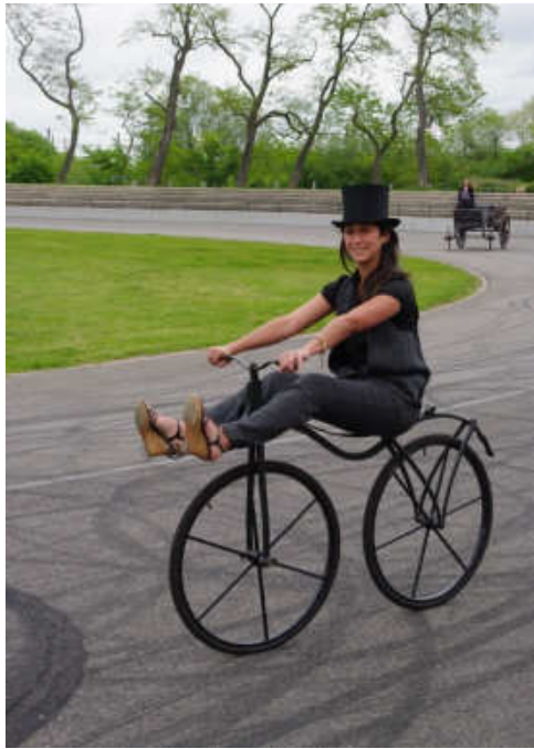
Zu Beginn des Museumsbesuchs verfolgten eine Präsentation von Fahrzeugen aus dem Museumsbestand auf dem Motodrom Auf dem Foto wird ein Laufrad aus dem Museumsbestand präsentiert.