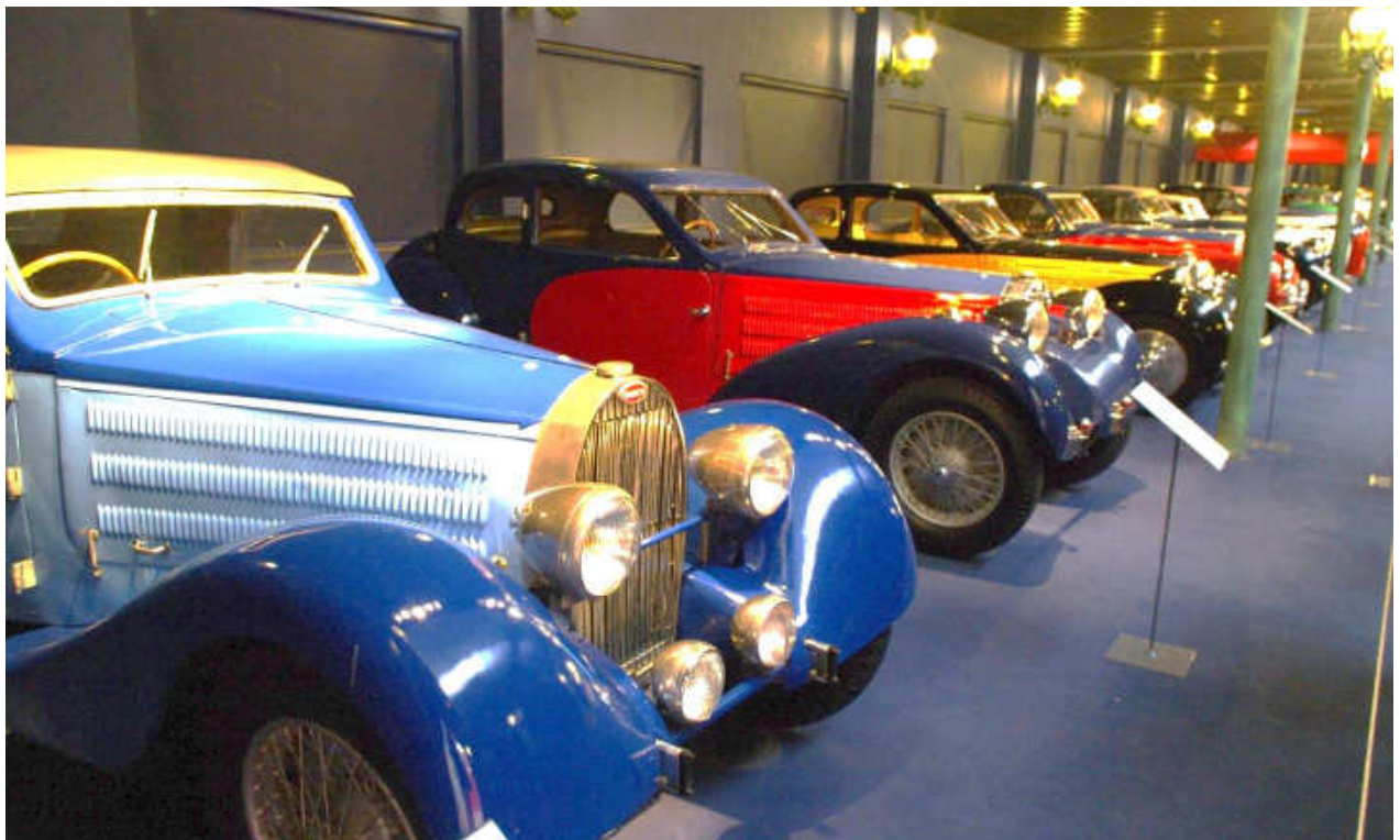
die Bestände des Museums sind so umfangreich, dass es schwerfällt ein einziges Foto für den Kurier auszuwählen, aber die Bugatti Sammlung ist sicher die größte Rarität