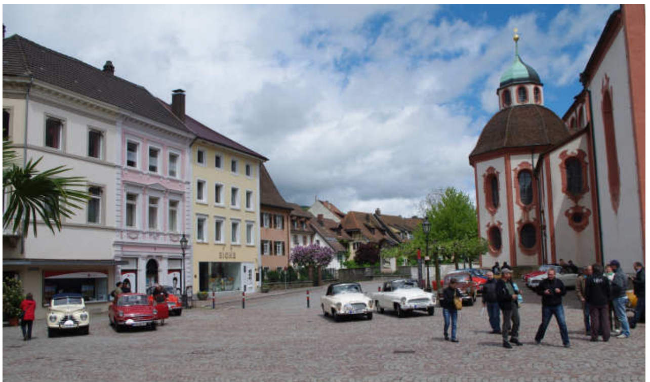
mit einem Besuch in Bad Säckingen am Sonntag, war für viele Teilnehmer das Frühjahrestreffen im Dreiländereck zu Ende