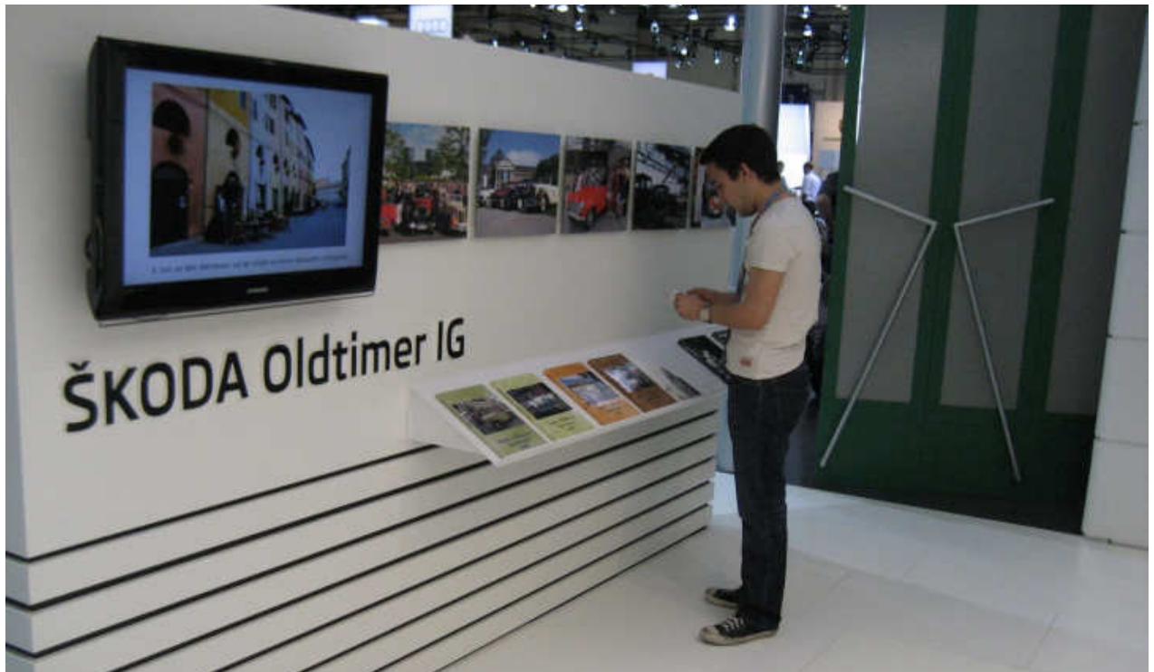
Die Škoda Oldtimer IG hatte erstmals Gelegenheit ihre Aktivitäten zu besonderen Ausfahrten und Treffen an einer Bilderwand und einem Bildschirm zu präsentieren. Auf der Buchkonsole wurden die Fotobücher der Jahrgänge 2008 bis 2012 ausgestellt.