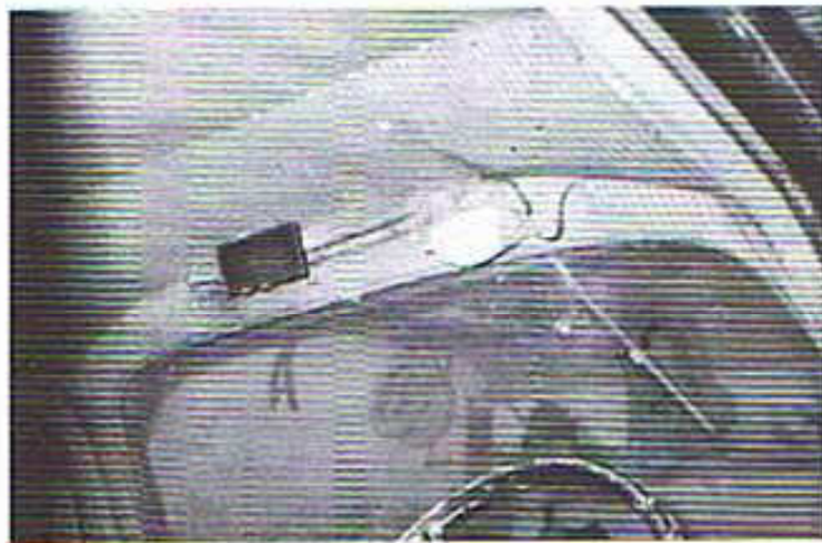
..... der Rapid braucht Zuwendung