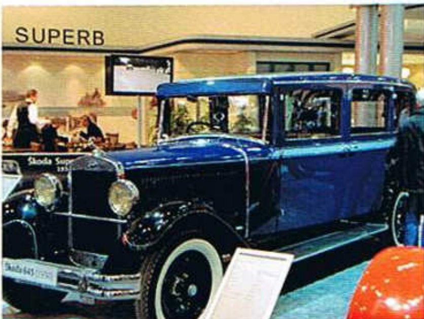
Skoda Superb 645 Baujahr 1931 aus dem Fuhrpark von Peter Sudeck