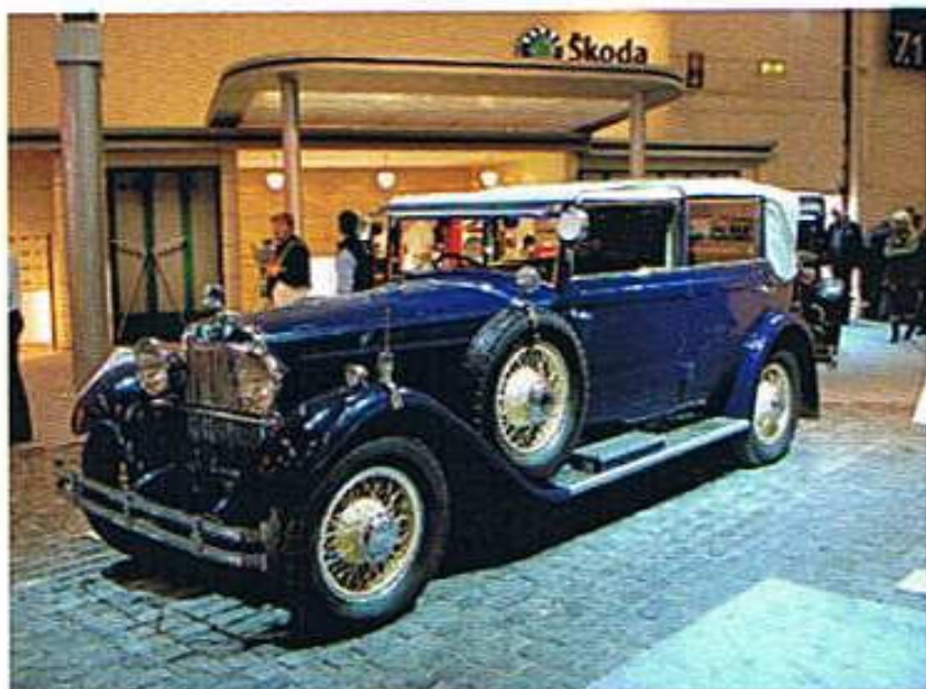
Skoda 860 Cabriolet de Ville Baujahr 1932 aus dem Museum in Mlada Boleslav