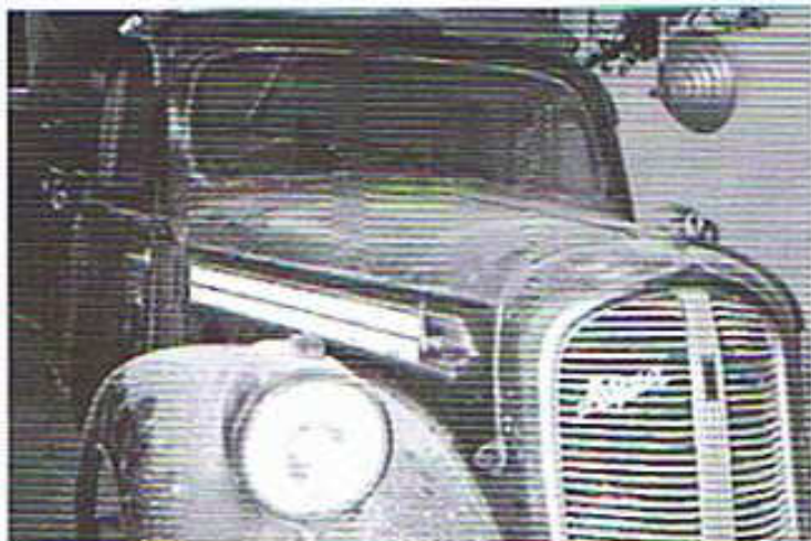
Bestandsaufnahme 1996 .....