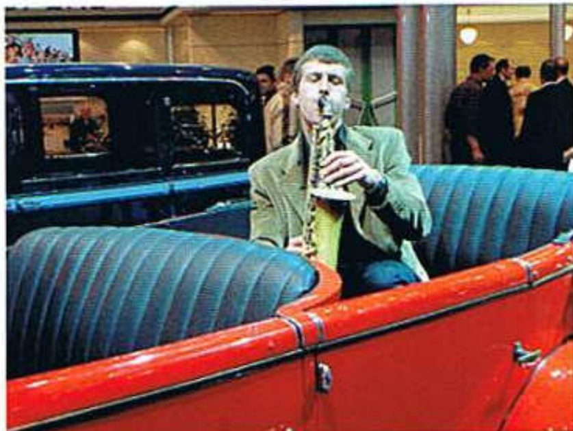
Altes Auto und Junger Musiker Saxophonspieler im L&K 110 unterhält das Publikum