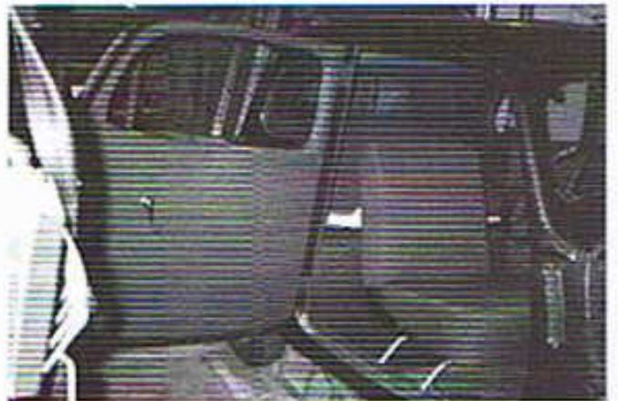
und Innenraum sind überholt