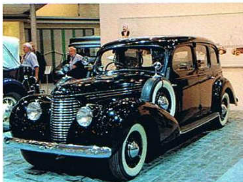
Skoda Superb OHV Baujahr 1939