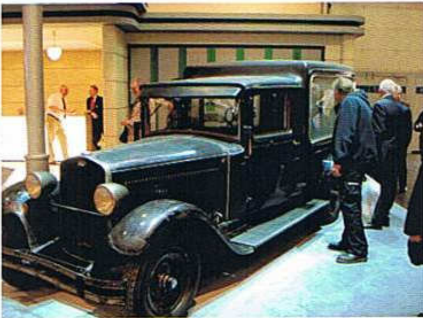
Skoda 645 Baujahr 1932 Bestattungswagen Einzelstück aus dem Museum in Mlada Boleslav