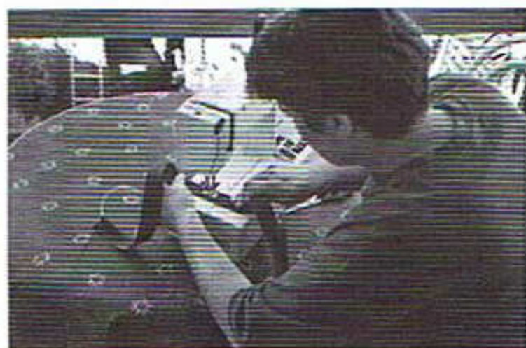
und seine Frau