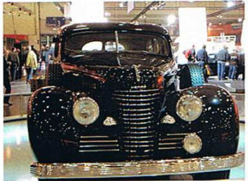
Skoda Superb 4000 Baujahr 1940 aus dem Skoda-Museum