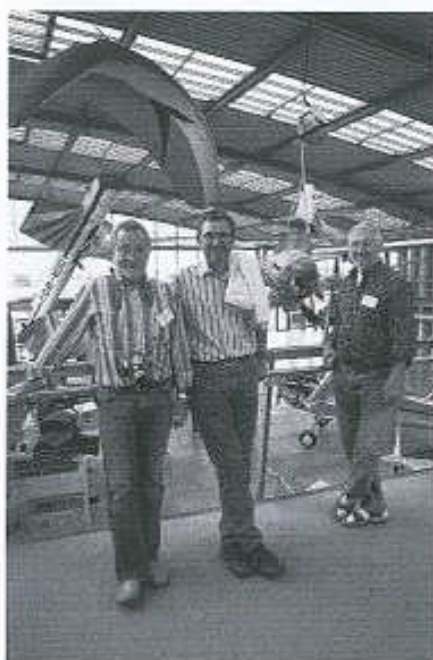
Bilder vom Clubtreffen