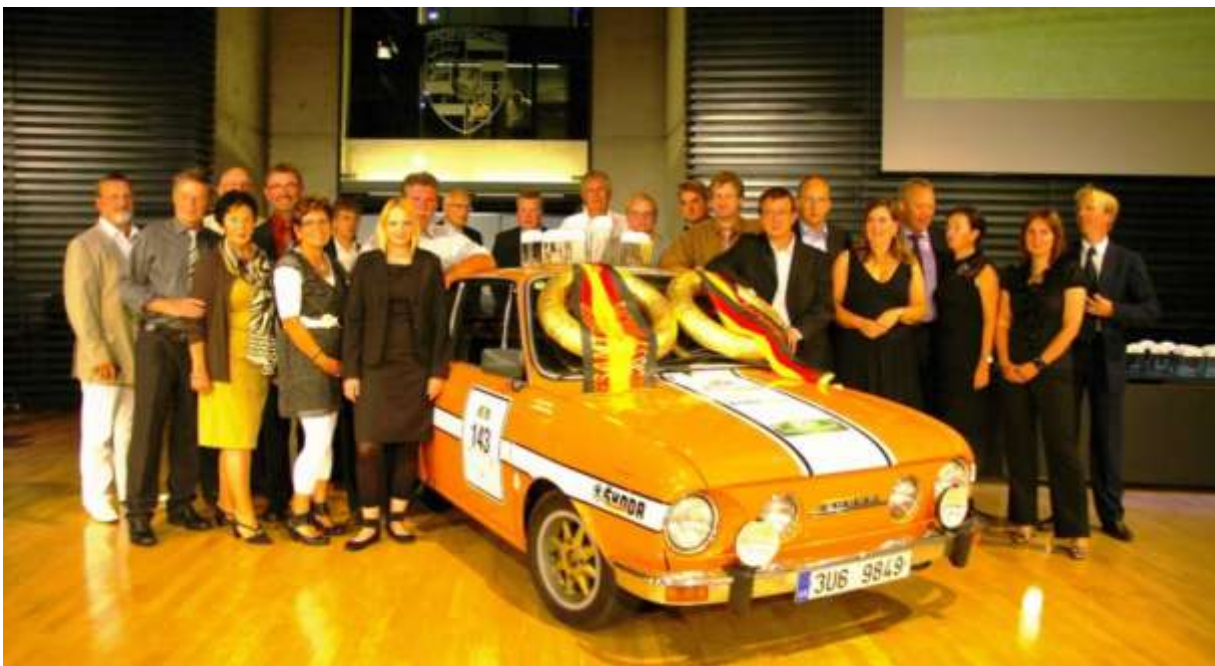
3 tolle Tage und gern würden wir mal wieder an der Sachsen Classic oder einer anderen Rallye teilnehmen... die Teilnehmer