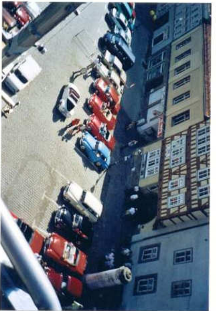
Luftaufnahme unserer Skoda Oldtimer in Arnstadt