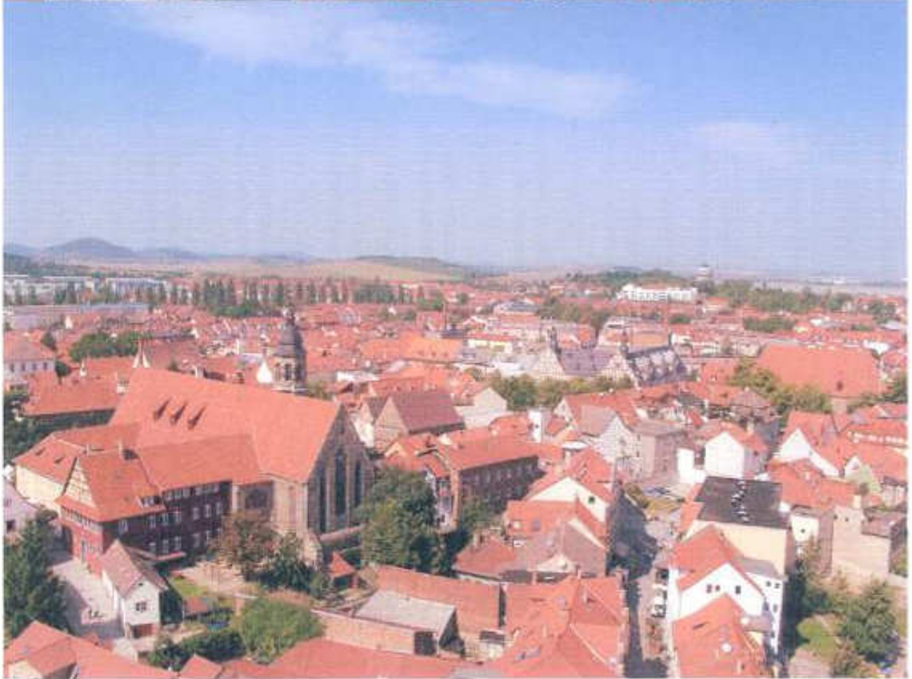
Abbildung 1 und 2 Luftaufnahme Arnstadt